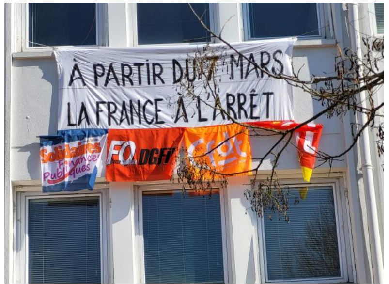
Maine et Loire: Banderole accrochée aux fenêtres du site d'Angers

Seine et Marne: distribution de tracts et vente de café à la gare de Val d'Europe