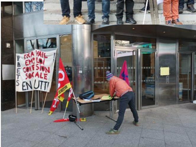
Haute Garonne: piquet de grève avec les agent.es de la cité administrative devant les locaux.