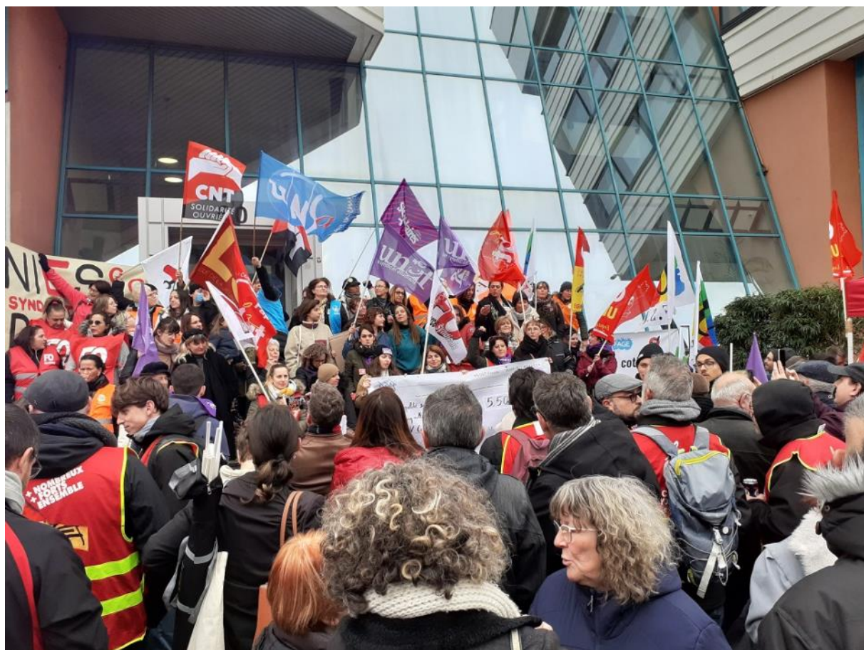
Dans le Rhône, participation à un rassemblement devant le siège du MEDEF