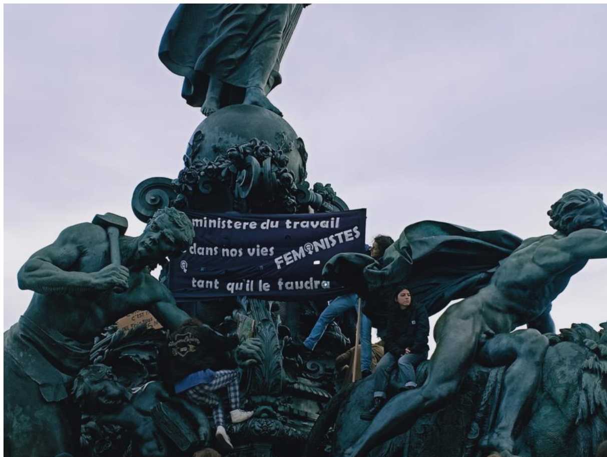
Notre banderole sur la statue de la Nation à Paris